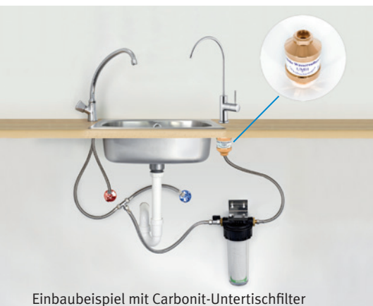
Einbaubeispiel mit Carbonit-Untertischfilter

Ich möchte mich bei Ihnen auf diesem Weg recht herzlich für ein echtes Stück Lebensqualität bedanken. Ich benutze Ihre Produkte mittlerweile seit mehr als zwei Jahren. Sie wissen von meinem Wunsch mich möglichst natürlich zu ernähren, und ich kann heute wirklich sagen, dass ich mich mit meinem Wasser sehr sicher fühle. Mit meinem Untertischfilter bin ich bis heute ausgesprochen zufrieden. Den „Frischekick“ des UMH Wirblers genieße ich wie am ersten Tag. Ich möchte heute kein anderes Wasser mehr trinken.